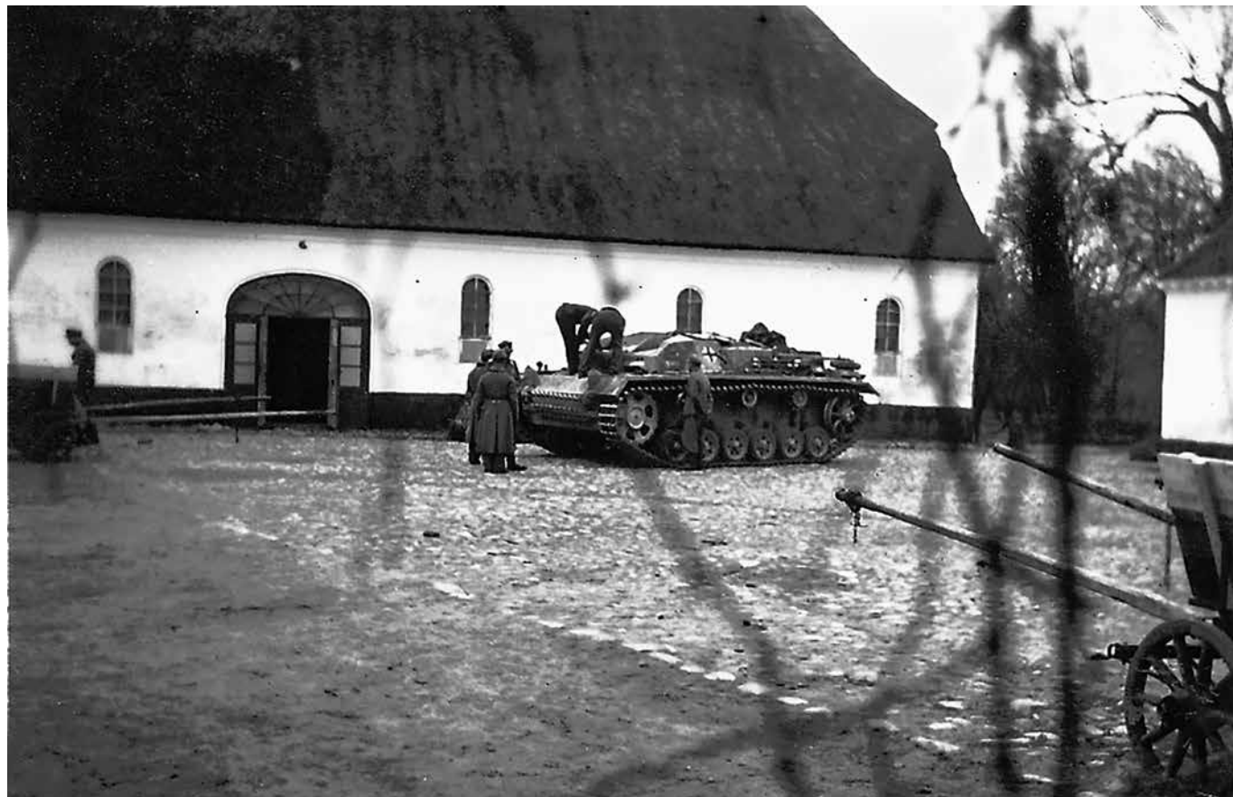
Rødding Højskole: Tysk tank har fået motorproblemer marts 1945.

7. maj forlod soldaterne og 11. maj flygtningene højskolen, så sommerskolen kunne åbne 2. juni 1945.