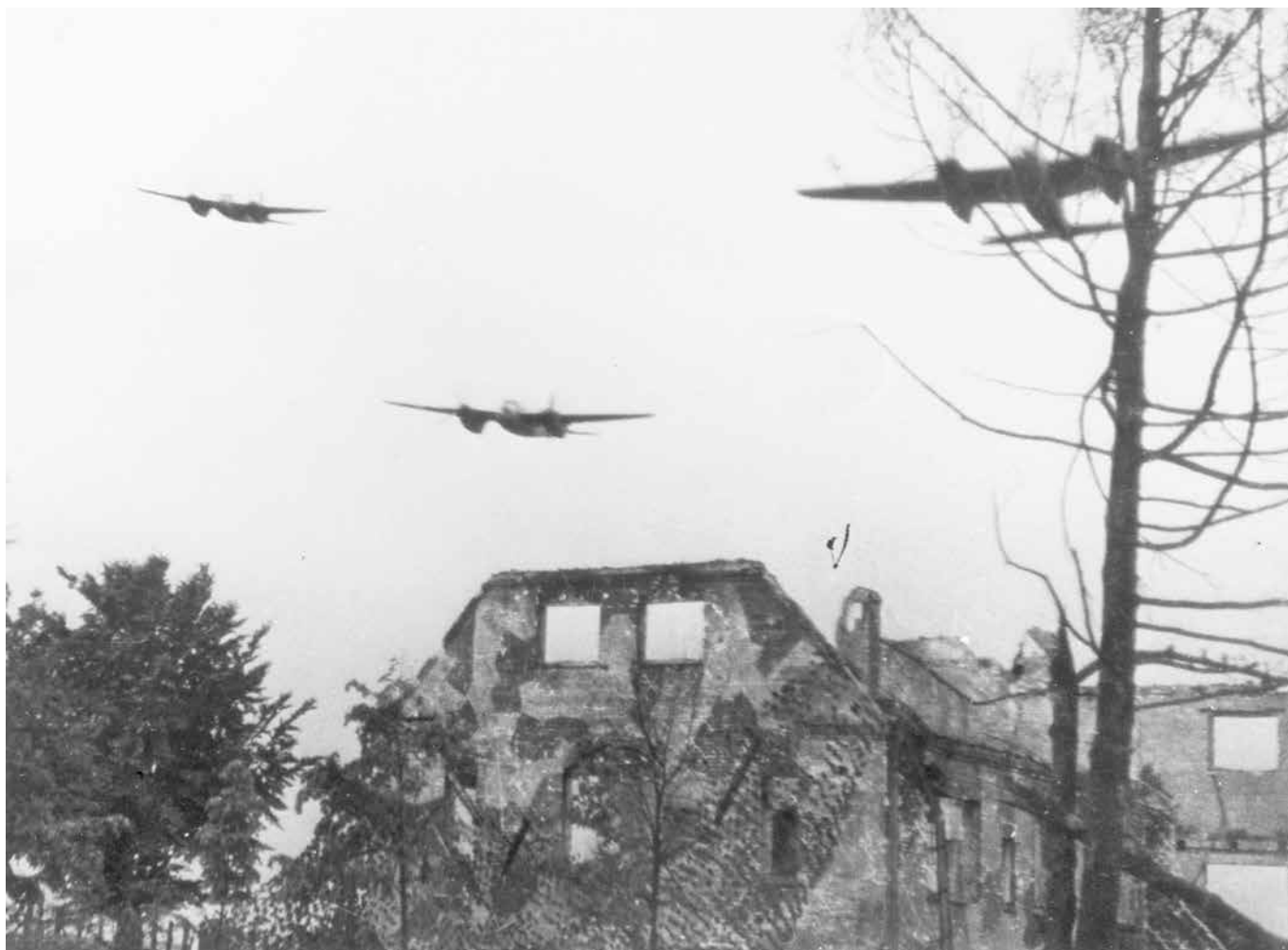
På billedet ses engelske Mosquitobombere over Husmandsskolens ruiner 24. maj 1945. Bemærk bygningernes bemaling og det sribede camouflagenet, der stadig hang ned fra den udbrændte østlige gavl.

Paarup lokalarkiv har en beretning fra en mand, der som dreng oplevede den afbildede begivenhed: