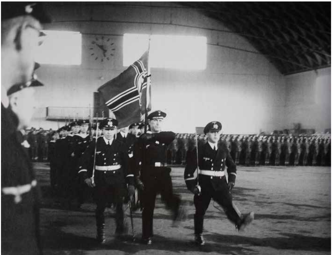
Militærparade i Idrætshallen på Gymnastikhøjskolen 1944.

8. oktober 1943 blev de tre Ollerup-skoler samt Højskolehjemmet beslaglagt af den tyske krigsmarine. Bukh måtte sende afbud til 285 karle til novemberholdet 1944, men fik lavet en aftale med Ladelund Landbrugsskole og sommerens pigeskole kunne åbne maj 1944 med 160