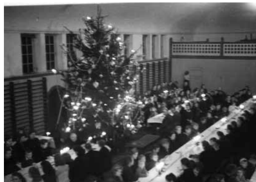
Flygtninge på Ryslinge Højskole samlet i gymnastiksalen til juleaften 1945.

"Det hidtil mærkeligste år i Ryslinge Højskoles historie er gået til ende. To gange har skolen været taget i brug til andet formål. Det ses også på elevlisten og på min tegnebog, da der er påført skolen betydelige tab."