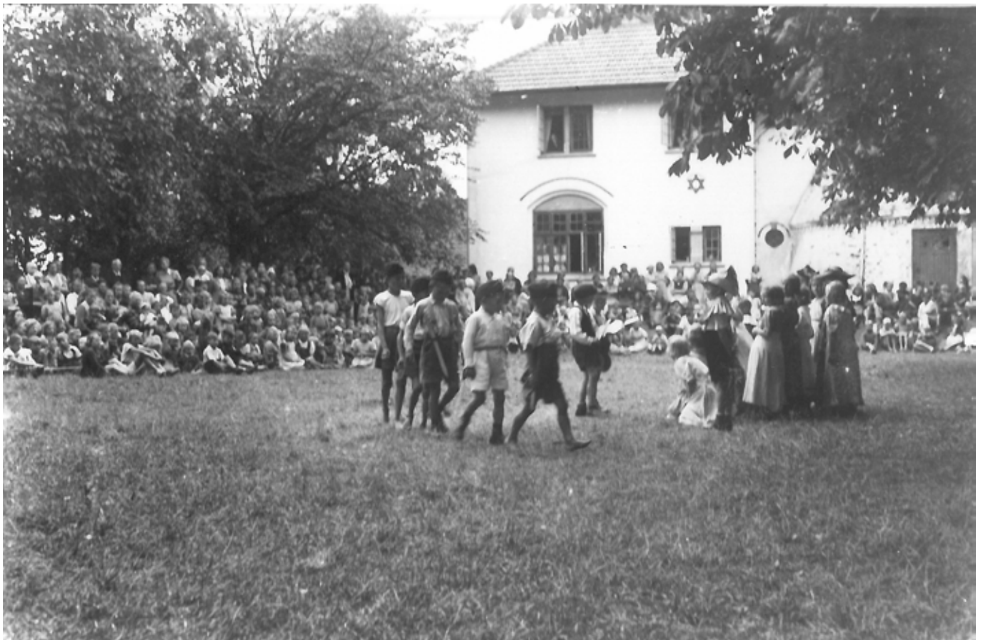
Flygtningebørn optræder på plænen mellem Møllen og Borgen på Ollerup Folkehøjskole sommeren 1945.