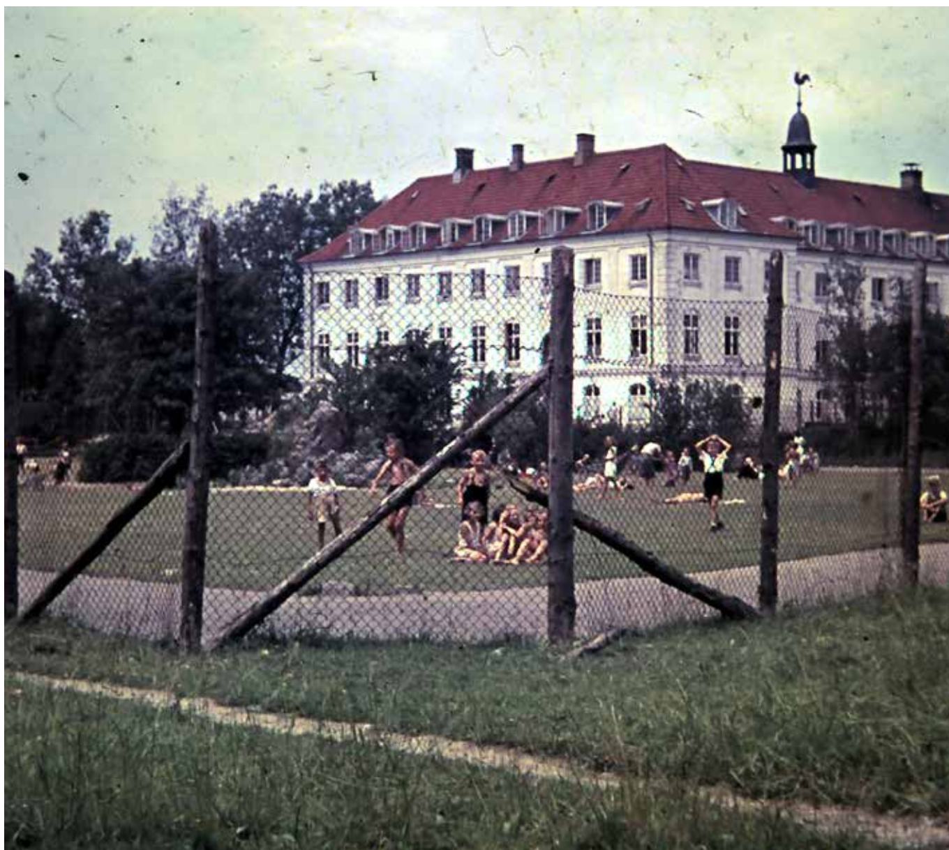
Flygtningebørn interneret på Fårevejle Sygeplejehøjskole sommeren 1945.