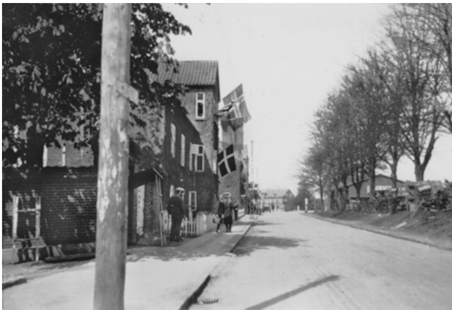
5. maj 1945 stod tyske soldater vagt ved Ry Højskole, der til gengæld fejrede befrielsen med samtlige nordiske flag hængende ud af vinduerne på Stationsvej i Ry.