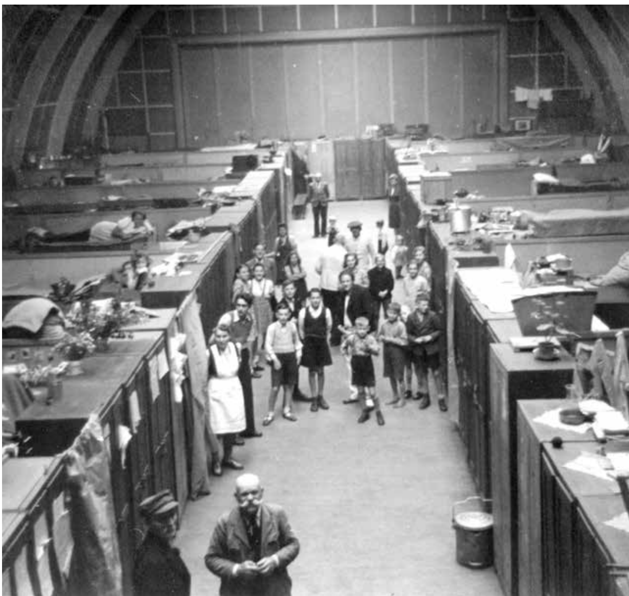
Flygtningeindkvartering i OD-hallen, Ollerup Gymnastikhøjskole 1946.