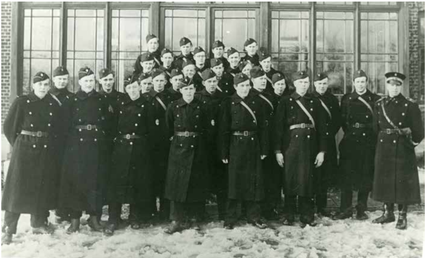
Nyindkaldte politi- og CB-aspiranter på Odder Højskole, marts 1944.

“Seks måneder senere blev skolen stormet af Gestapo og alle unge politifolk blev afvæbnet og ført bort.”